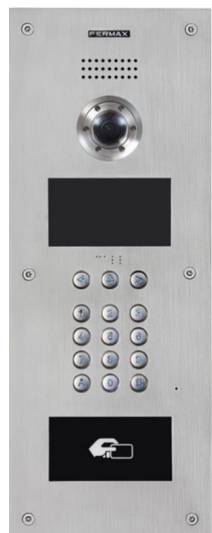
Marine Panel Meet